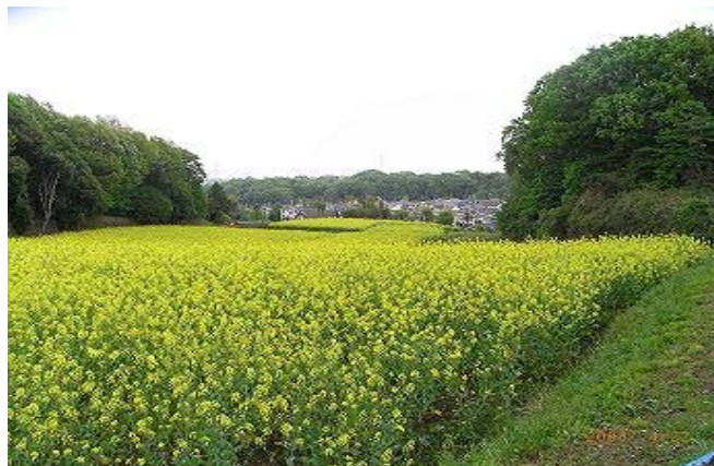
七国山の菜の花畑