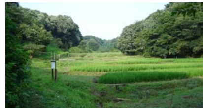
小野路町 奈良ばいの谷戸風景