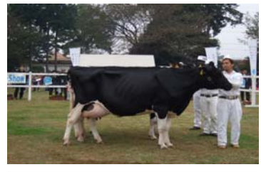
東京都乳牛共進会入賞牛