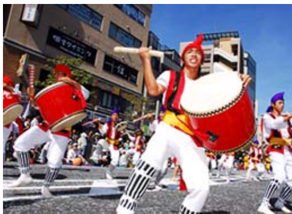
商店街事業～フェスタ町田

町田市新元気をさせ商店街事業補助金 50,435千円 商店街街路灯補助金 3,810千円 町田商工会議所中小企業相談所事業補助金 13,000千円 町田商工会議所産業振興事業補助金 17,000千円