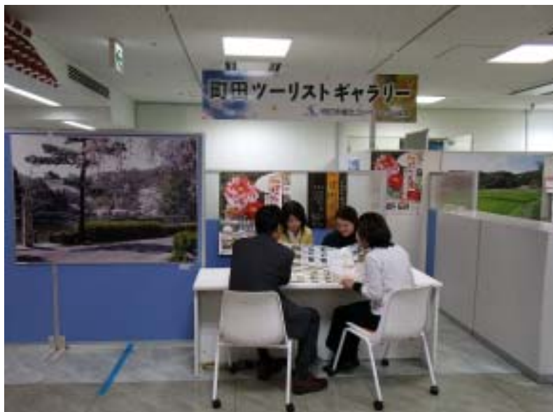
町田ツーリストギャラリー