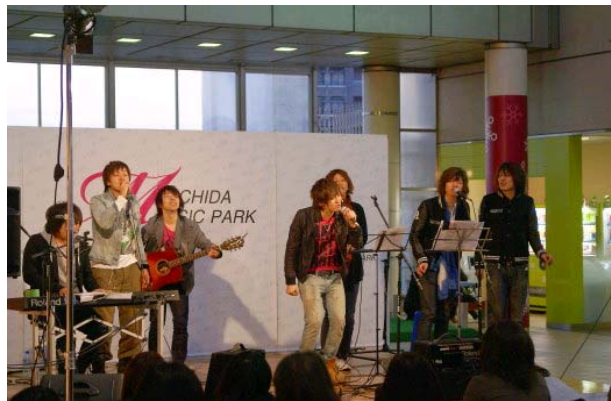
ターミナル市民広場のイベント～町田ミュージックパーク