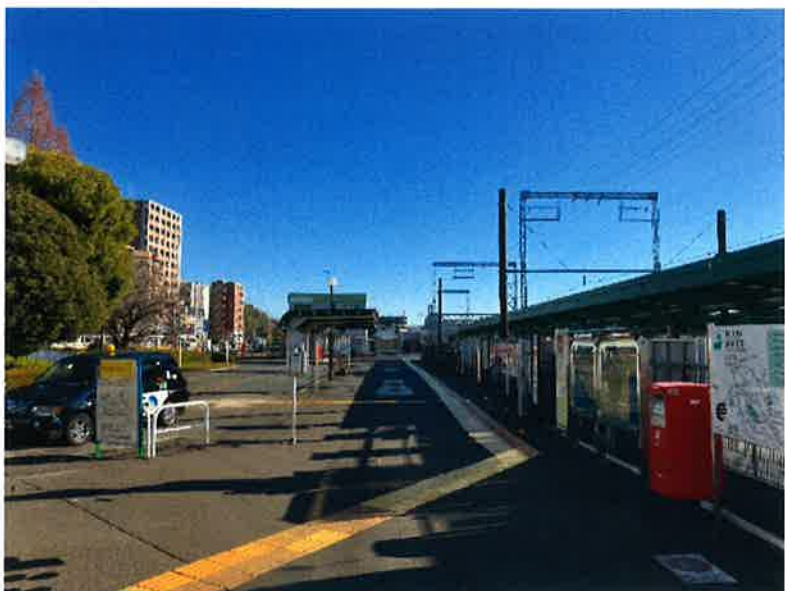
② 現況のバスシェルター