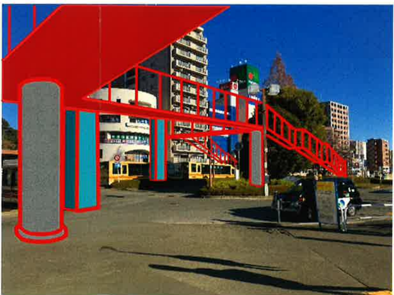
③ 計画予定地の現況