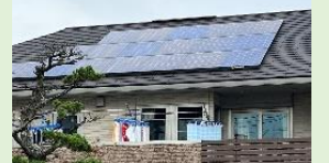
戸建住宅のソーラーパネル