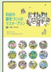
町田市都市づくりのマスタープラン