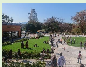
南町田グランベリーパーク 「土木学会デザイン賞 2021」において優秀賞を受賞 第1回グリーンインフラ大賞「都市空間部門」において、優秀賞を受賞