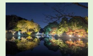
薬師池公園のライトアップ