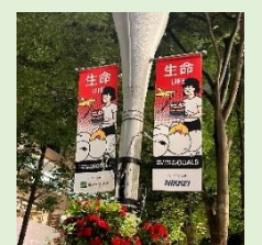
エリアマネジメント広告