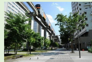
モノレールルート沿線のまちづくり事例（立川市サンサンロード：景観重要公共施設）