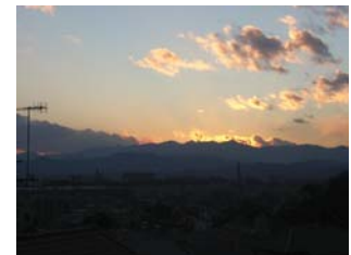
尾根緑道からみた夕景