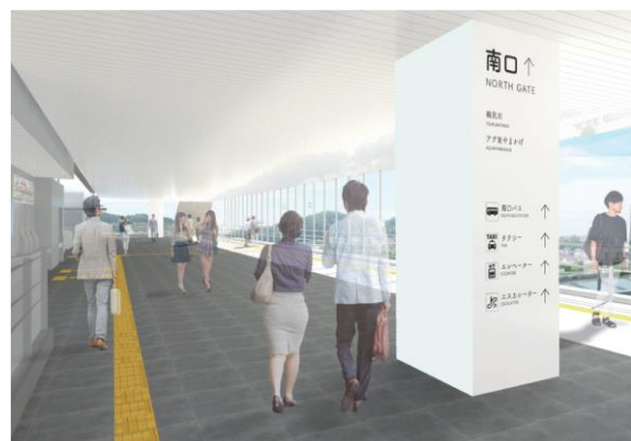
▲「南北自由通路」の内観イメージ