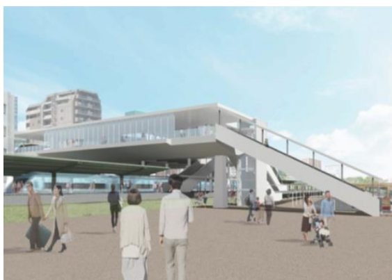
▲「南北自由通路」の外観イメージ