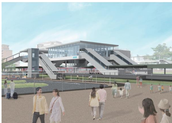
▲新しくなる「鶴川駅」の外観イメージ