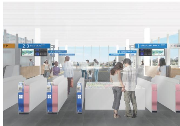
▲新しくなる「鶴川駅」改札口の内観イメージ