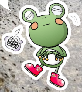
町田市下水道キャラクター「雨かえる」