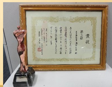
【賞状とトロフィー】

今年の夏は、記録的な猛暑日が続きましたね。そうかと思えば、大雨が続くなど天気が不安定です。災害への備えを万全にして過いさねはと強く感じる今日この頃です。