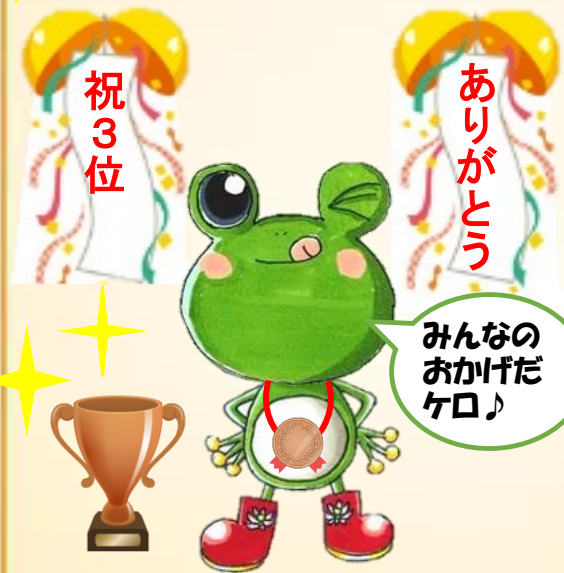
町田市下水道キャラクター 「雨かえる」

7月下旬に、下水道展'15 東京で行われた「第3回全国下水道マスコット総選挙」で、町田市の下水道キャラクター「雨かえる」が3位を獲得しました。「雨かえる」は、昨年行われた「町田市下水道キャラクター総選挙」で市民の皆様から1位に選ばれたキャラクターです。