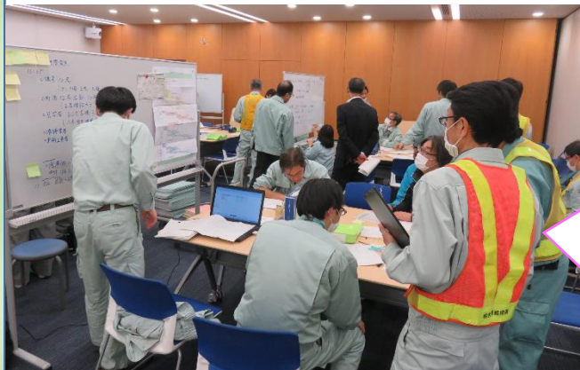
910 likes 18 comments #下水道 BCP #図上訓練 #下水道 BCM 部会