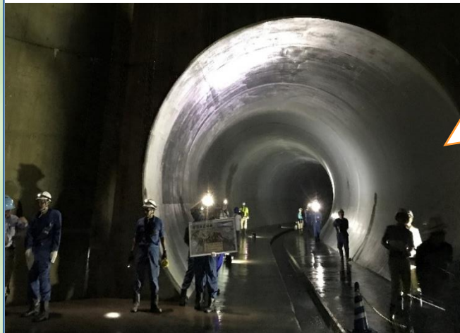
856 likes 16 comments #雨の通り道 #鶴見川 #総合治水 #横浜市