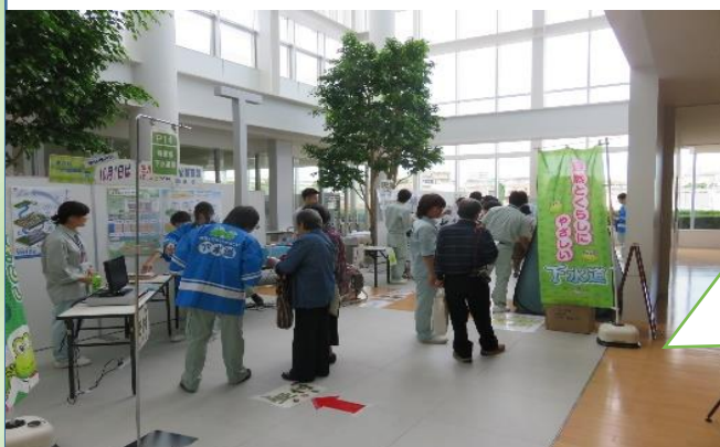
910 likes 20 comments #下水道 PR #エコフェスタ #グッズプレゼント