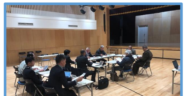
第5回地区連絡会【上小山田地区】の様子 (忠生市民センター)

第5回地区連絡会（2019年2月13日（水）開催）では、施設整備コンセプトや付帯施設についての検討を行い、整備コンセプトの決定をいたしました。