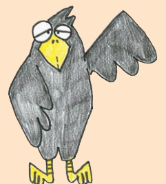
カラスの ハシブト