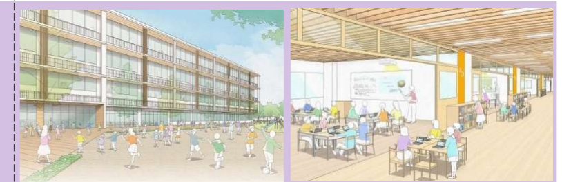
【出典】新たな学校づくり基本計画