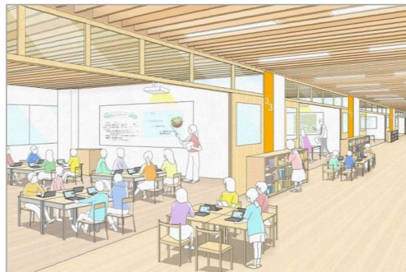
図 地域とともに育つ学校（地域の活動拠点としての学校）