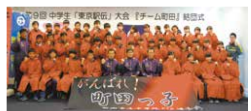
▲今年も大健闘のチーム町田(写真は結団式の様子)

町田市の代表チーム「チーム町田」は、男子の部で第4位、女子の部で第3位と素晴らしい成績を取め、男女のタイムの合計で総合第3位に輝きました。