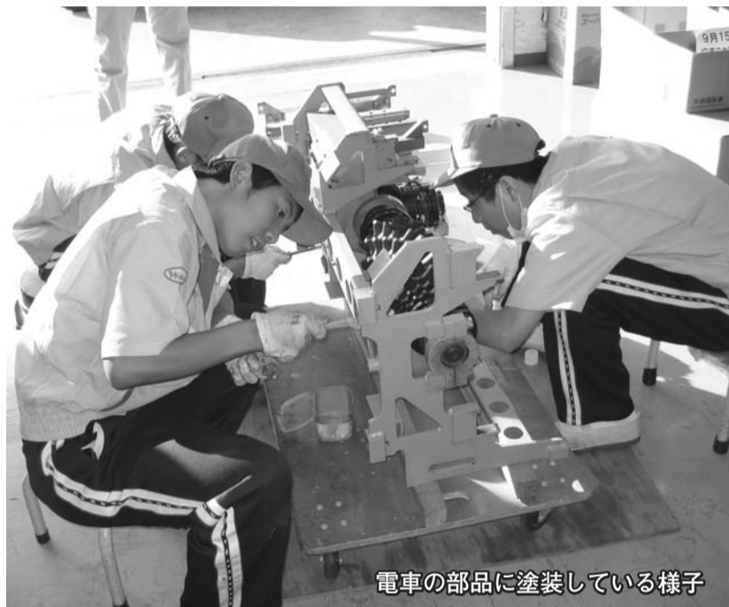
電車の部品に塗装している様子

2009年度の中学校2年生職場体験事業「地域で支えよう!町田っ子の未来探し」が、第一期9月14日~18日、第二期11月23日~27日、第三期1月25日~29日の3期に分けて実施されました。今年度は611の事業所様(複数回受け入れていただいた事業所も多数あり)で、3131人の生徒が職場体験をさせていただきました。ご協力ありがとうございました。ご協力ありがとうございました。