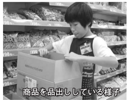
商品を品出ししている様子