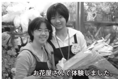
お花屋さんで体験しました。