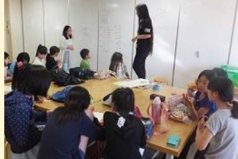
こ い いん ↑「子ども委員」