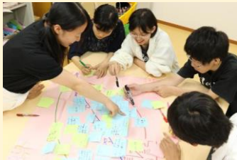
まちだそうぞう ↑「町田創造プロジェクト(MSP)」

まちだそうぞう 「町田創造プロジェクト (MSP)」、こ い いん 「子ども委員」、まちだししゅんさんか が たじぎょうひょうか 「町田市市民参加型事業評価」など