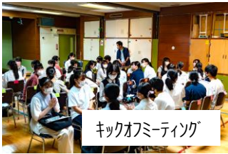
キックオフミーティング