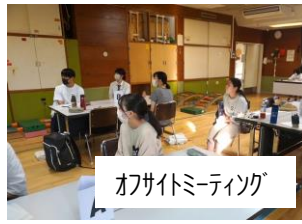
オフサイトミーティング