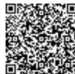
まちだコドマチ ルール 条例 (まちだ子育てサイト)

本条例をきっかけとして、みんながそれぞれの立場で何ができるかを考え、「子どもにやさしいまち」の実現に向けた具体的な行動につながるよう推進していきます。