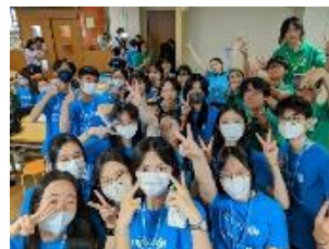
▲香港ユニセフ協会が子どもセンターただON等を視察