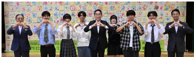
▲岸田元総理大臣が子どもセンターまあちを視察