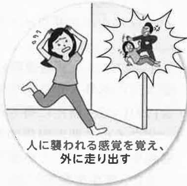
人に襲われる感覚を覚え、外に走り出す