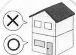
一戸建てにお住まいの場合は、できる限り1階で寝かせる