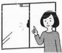
玄関や全ての部屋の窓を確実に施錠する(内鍵、チェーンロック、補助鍵がある場合は、その活用を含む)

発熱から少なくとも2日間、就寝中を含め、特に小児・未成年者が容易に住居外へ飛び出さないために、例えば、以下のような具体的な対策を講じるよう、保護者の方にご説明ください。