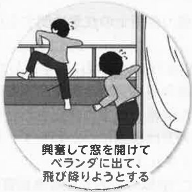
興奮して窓を開けてベランダに出て、飛び降りようとする