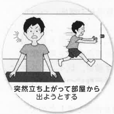
突然立ち上がって部屋から出ようとする