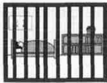
窓に格子のある部屋がある場合は、その部屋で寝かせる