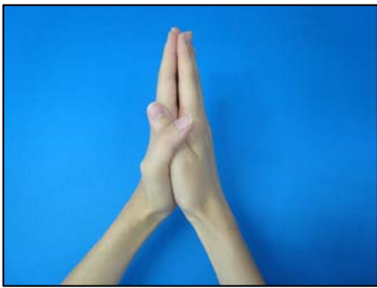
①手のひらをよくこする