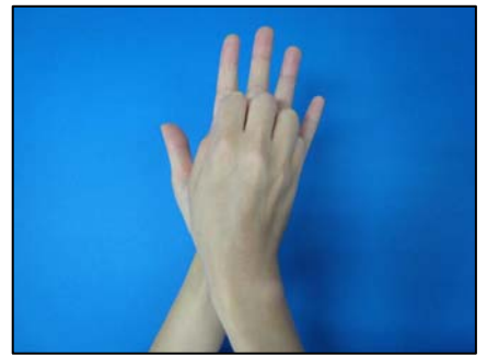
③指先とつめの間を念入りにこする