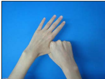
⑤親指の周りはねじるように洗う