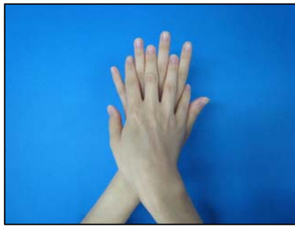
②手のこうをのばしてこする