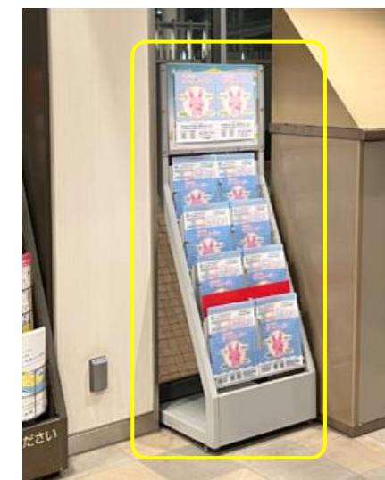
2023年9月 駅構内での普及啓発の様子