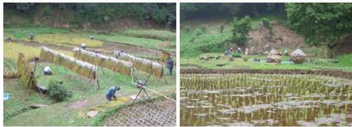
斜面林と谷の農地で構成されている「奈良ばい谷戸」は、NPO法人まちだ結の里により、保全が行われている。自然が体験できるイベントも実施。詳細は広報やホームページで。 奈良ばい谷戸 町田市小野路町607番地外 神奈川中央交通「扇橋」バス下車 徒歩約4分