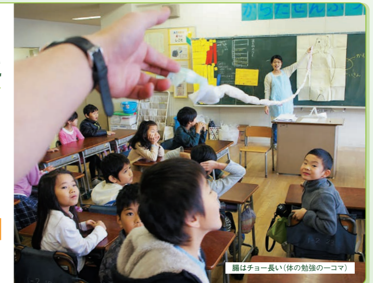
腕はチョー長い(体の勉強のーコマ)