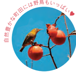
自然豊かな町田には野鳥もいっぱい