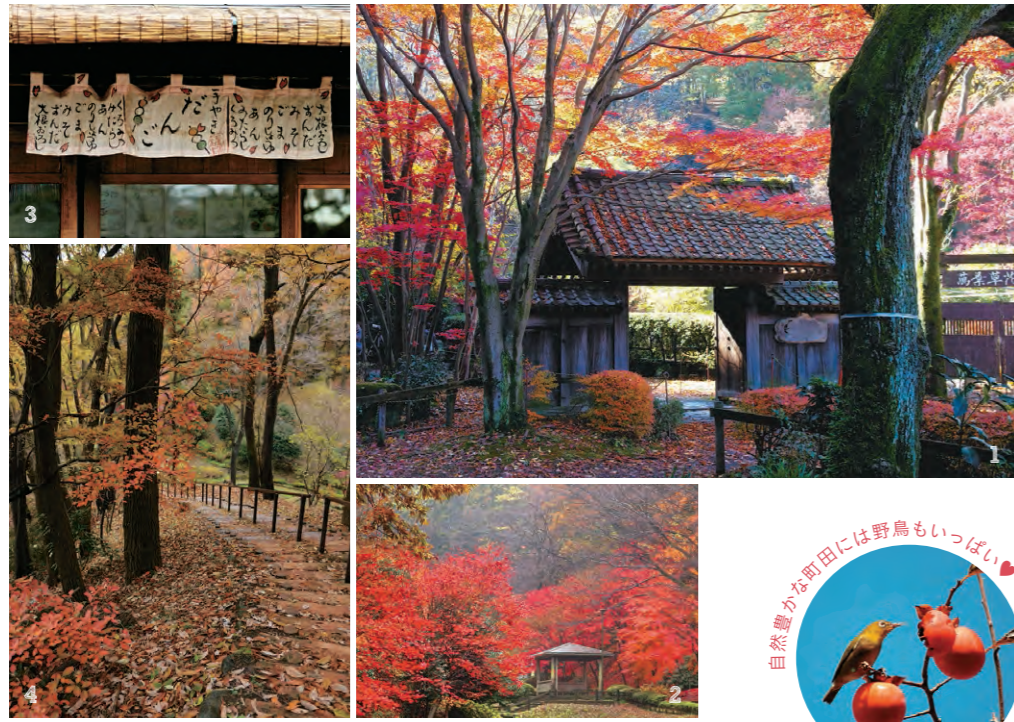
秋色に美しく染まる薬師池公園 1. 萬葉草木苑前の薬医門 2. 茜色に染まった撮影スポットがいっぱい 3. お餅や甘味などが頂けるやし茶屋 4. ゆっくり散歩できる散歩道も