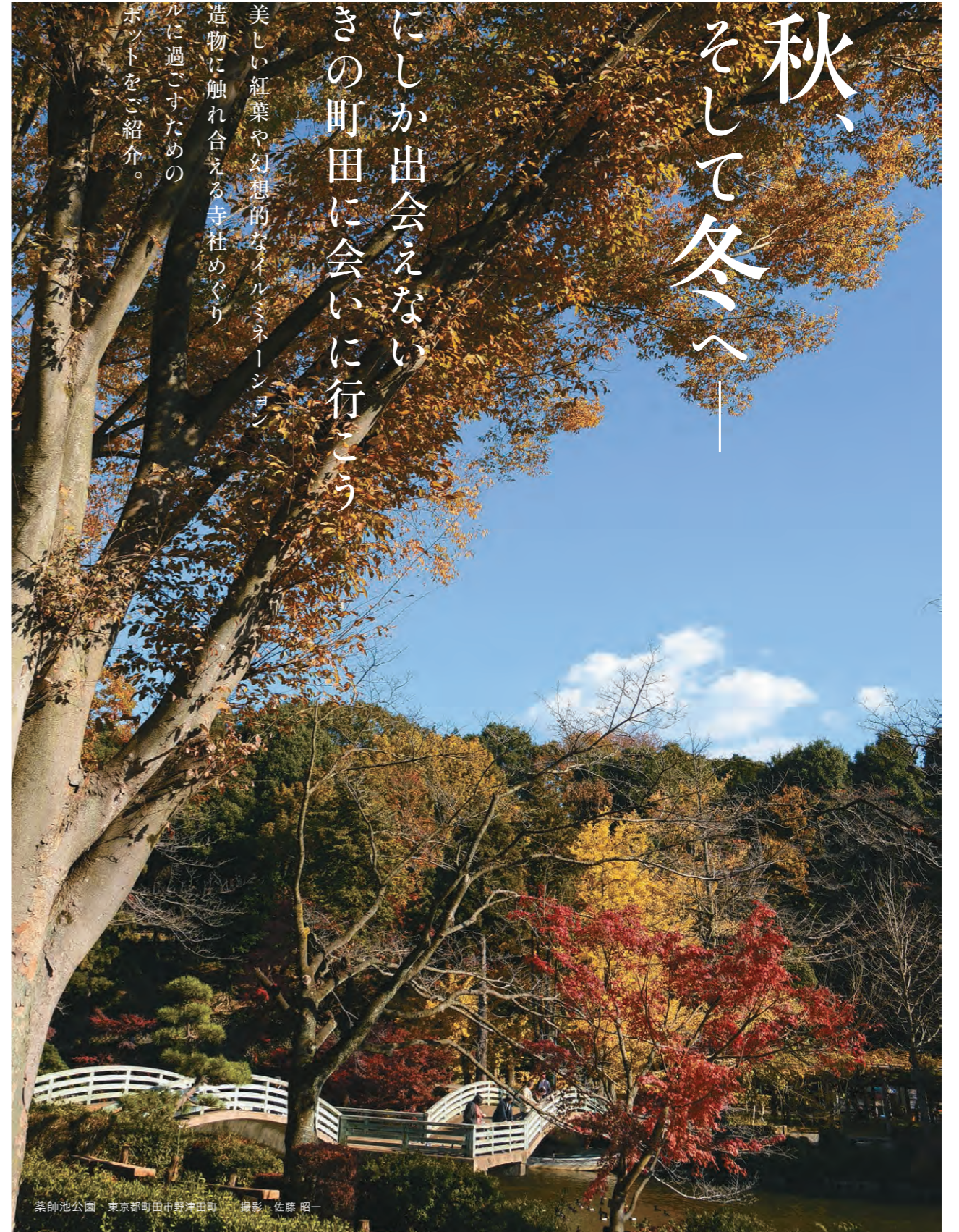
薬師池公園 東京都町田市野津田町