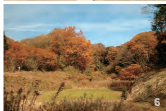
5. 周囲を囲む木々の色づきが秋を感じさせる三輪の熊野神社 6. 風情溢れる秋の五反田谷戸 7. 抜けるような青空とのコントラストが美しい国際版画美術館前の銀杏 8. 雄大な自然美を思いつきり満喫できる秋の尾根緑道 9. 秋の装いが美しい鶴間公園を貫く水道みち