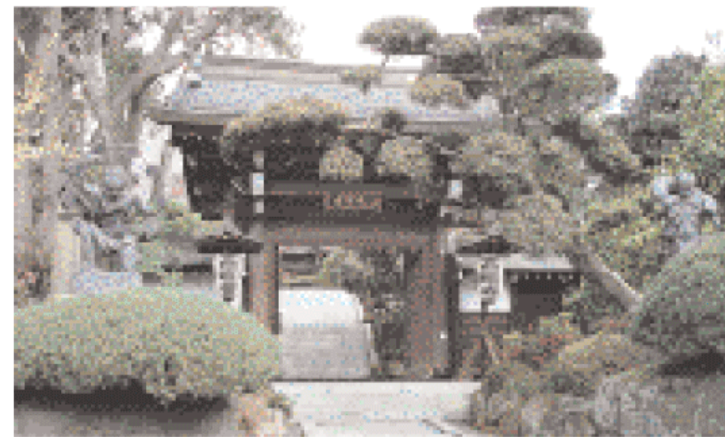
高蔵寺境内には多くの樹木が植えられ春は一面にシャクナゲが咲く。