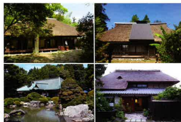
鶴川にある4つの古民家(左上:武相荘、右上:みんなの古民家、左下:香山園、右下:可喜庵)

鶴川にある4つの古民家（香山園、武相荘、可喜庵、みんなの古民家）と地域が心を込めてOMOTENASHIをいたします。ラグビーW杯の開催期間中に外国人観光客も楽しめるイベントを同時開催します。4つの古民家を周遊する散策ルートの開発や鶴川地域の魅力的な場所・店・人・イベントの情報を発信するとともに、10月4日・5日・6日には4つの古民家が連携したイベントを行い、地域が一体となった鶴川の観光拠点としての可能性を探ります。 また、地域の方々に自分の住む鶴川地域の魅力を再認識してもらい、地域への愛着を高めるとともに鶴川への関心を高め、来訪者の増加につなげるものです。鶴川を堪能してもらおうと企画を練っています。お楽しみに・・・！