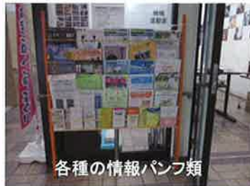
各種の情報パンフレット