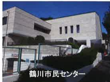
鶴川市民センター

2016.11.1に鶴川市民センターの1階にオープンし1.5年になります。鶴川地区14の町を管轄に集いのCafé、ボランティアセンターとなっています。お気軽にお越し下さい。色々な情報や各種の活動等ご紹介します。