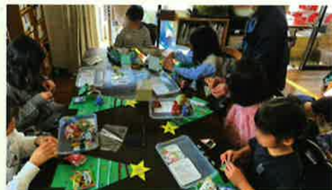
「お楽しみDay・クリスマス会でのアドベントカレンダー作り」