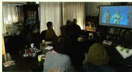
「ふれあいブックカフェ・中村哲氏の活動記録ドキュメンタリー上映会」