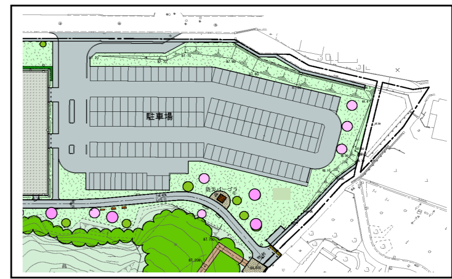
将来駐車場計画図