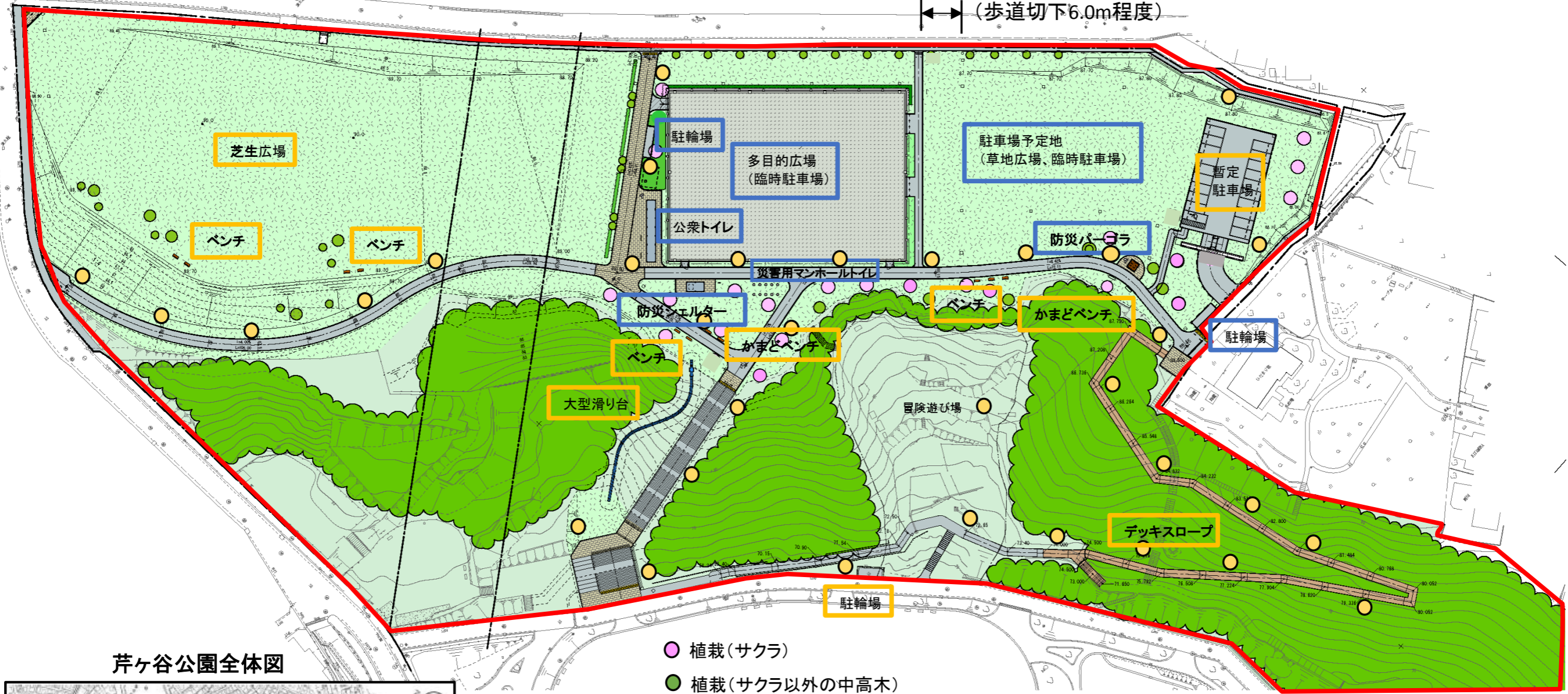
芹ヶ谷公園全体図