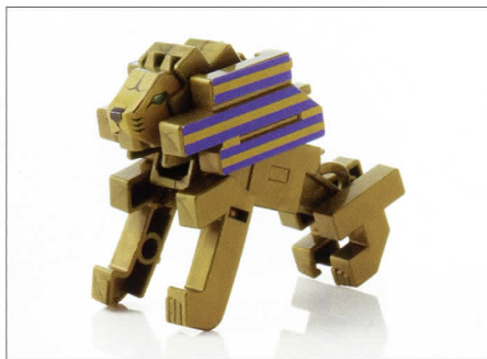
超変換!! もじバケる