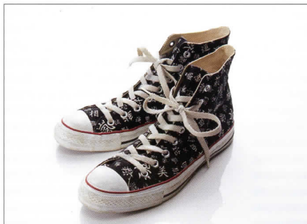
漢字がデザインされたCONVERSEオールスター