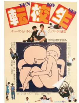
映画「転校生」ポスター (原作:『おれがあいつであいつがおれで』) 市立小樽文学館蔵