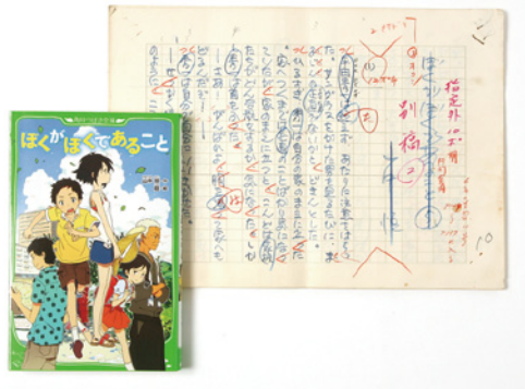
原稿「ぼくがぼくであること」市立小樽文学館蔵 角川つばさ文庫版「ぼくがぼくであること」(2012年、角川書店) 当館蔵