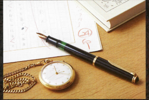
愛用した万年筆と懐中時計