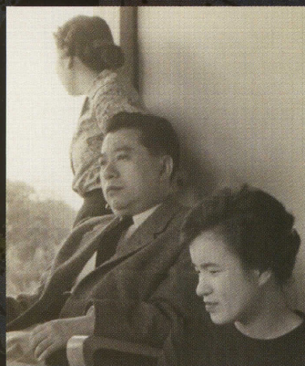
箱根の温泉旅館にて、妻と娘と一緒に(1960年代前半)

●10月27日[火]・11月8日[日]・11月17日[火]・12月20日[日] 14:00—(40分程度)