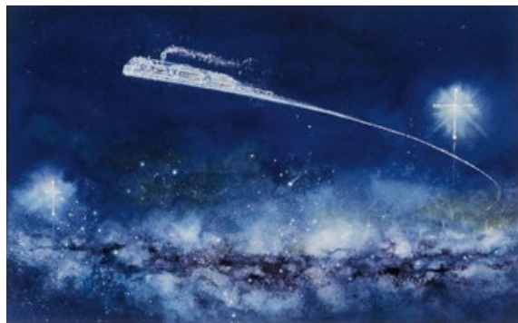
東逸子「銀河鉄道の夜」1993年 くもん出版