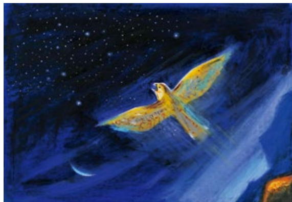
篠崎三朗「よだかの星」1996年 童心社