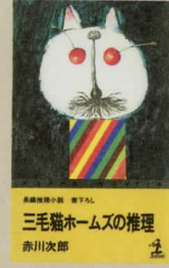
「三毛猫ホームズの推理」光文社 1978年4月デビューの2年後に刊行された書下ろし長編ミステリー。「三毛猫ホームズ」シリーズの記念すべき第1作である本作が話題となり、執筆依頼が殺到。これを機にサラリーマンを辞めて作家専業となった。