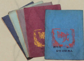
同人誌「いさり火」創刊号～第5号 1967～69年 日本機械学会に勤めていた頃に会社の同僚と作っていた同人誌。全5号。赤川は、武田博之というペンネームで小説や評論を寄稿している。（個人蔵）