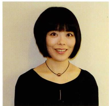
俵万智 たわら まち

本展覧会では、これまでの歌集のなかから、子どもや家族、恋人など身近な人との日々のお出合いから紡ぎだされた短歌を、写真やイラストとともに視覚的にご紹介します。三十一文字により織り広げられるひとつひとつの物語から、人を想って揺れる心、愛しき人への素直な想いを感じていただければと思います。