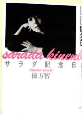
▲「サラダ記念日」 (河出書房新社 1987年)