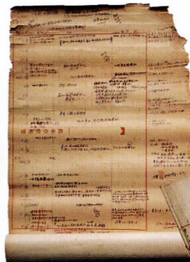
←『画狂人北斎』の執筆メモ 原稿用紙を次々継いで4mにも及んでいます