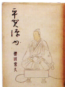
↑ 芥川賞受賞作『平賀源内』（1941年刊）