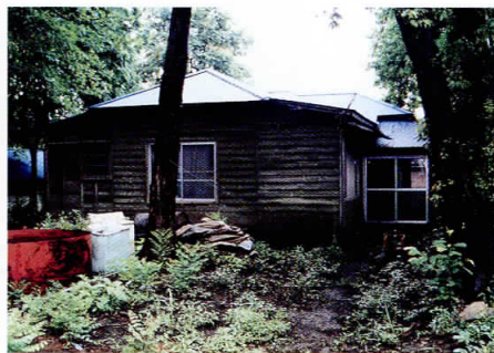
↑ 自宅の書斎 万木草堂（本町田）