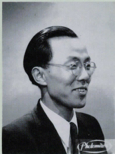
1950年(27歳) フランス留学の頃