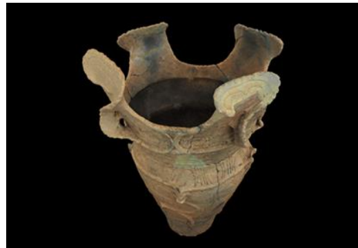
「町田デジタルミュージアム」 トップページ