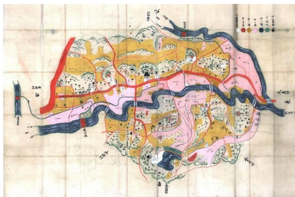
このような昔の地図を使って地域について学びます 野津田村絵図