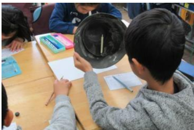
昔の道具を触りながら授業を行います