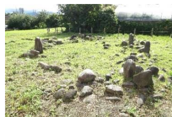
田端環状積石遺構

縄文時代の環状積石遺構(ストーンサークル)が発見された遺跡です。実物は保存のため埋め戻しており、その上に復元された環状積石遺構(ストーンサークル)を見学できます。