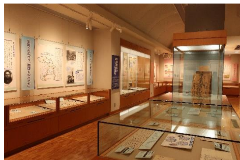
常設展「自由民権運動と町田」