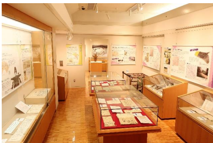
町田市立自由民権資料館