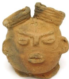
モデルになった中空土偶頭部

モデルになった「中空土偶頭部」は、実物を町田市考古資料室で、レプリカを町田市立自由民権資料館で見学することができます。町田市内の小学校では「まっくう給食」を実施している学校もあり、小学生から人気のあるキャラクターです。