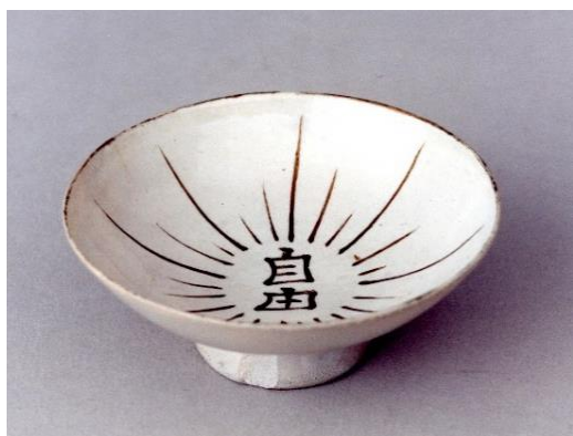
自由民権資料館の所蔵している資料を活用し、授業を進めます 自由の盃(複製)