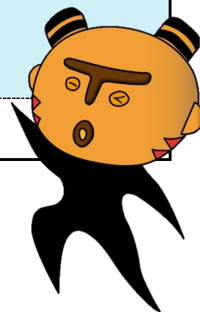
まちだ縄文キャラクター「まっくう」