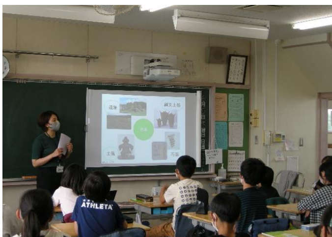
授業の復習をした後、実際の資料をさわります